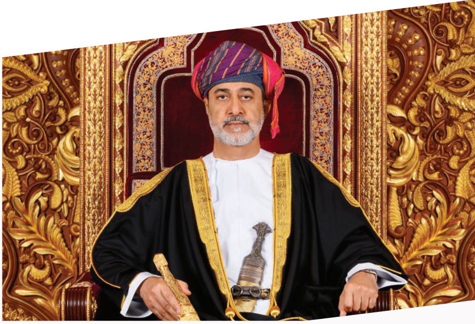
حضرة صاحب الجلالة السلطان هيثم بن طارق المعظم - حفظه الله ورعاه -