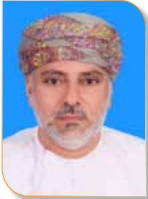
الفاضل / راشد بن سيف بن سليمان البيماني

رئيس مجلس الإدارة الوظيفة: رئيس غرفة تجارة وصناعة عمان