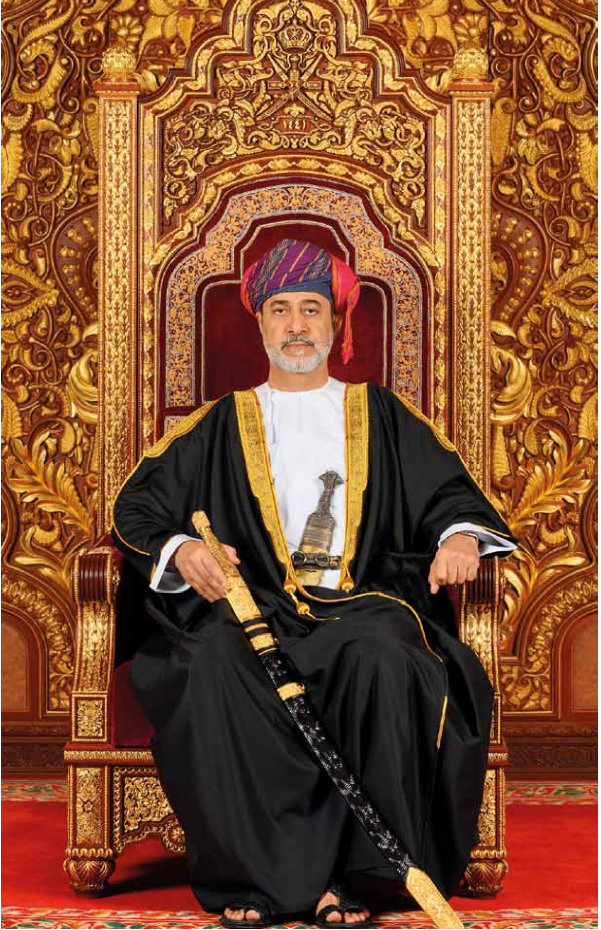
حضرة صاحب الجلالة السلطان هيثم بن طارق المعظم - حفظه الله ورعاه